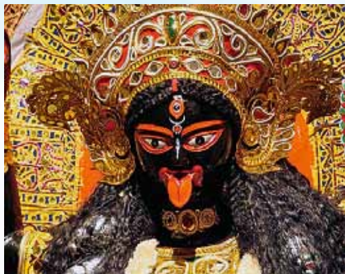
Ἡ αἱμοδιψὴς Kali Mata, ἢ Σκοτεινὴ Μητέρα.