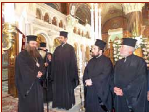
Με τὸν Μητροπολίτη Χίου κ.κ. Μάρκο