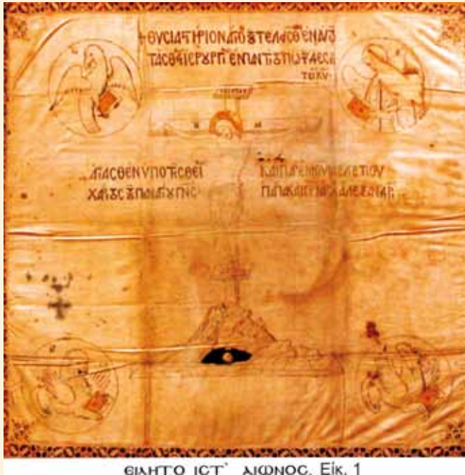
ΕΙΗΤΟ ΙΣΤ΄ ΑΙΩΝΟΣ. Είκ. 1

χνοτροπίας. Χαρακτηριστικό του άμφιου είναι η άπλότητα εξιστορήσεως τών θεμάτων, τά όποία εικονίζου: Τή Σταύρωση και τούς Εύαγγελιστές μέ τά ζωόμορφα σύμβολά τους, στή σειρά Ιωάννης, Ματθαίος, Μάρκος και Λουκάς. Οί πληροφορίες, πού μάς παρέχει τό ίδιο είναι διατυπωμένες έντός τής όθόνης μέ πολλές συντμήσεις, πού συμπλέκονται μέ τόνους και πνεύματα, σέ κεφαλαιογράμματα βυζαντινή σημειογραφία και άναγράφου: