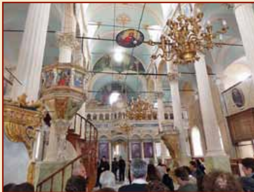
Ὁ Ναός τοῦ Ταξιάρχου στό Ἄϊβαλί

Τὶ ξεχωριστὸ κρύβουν οἱ κορυφές τῶν μικρῶν βουνῶν πού μας περιμένουν καὶ πού μας ὑποδέχονται μαζί με τὸν ἰδιόμορφο Τρουῖλο τοῦ Ἁγίου Θεράποντα. Καὶ τί κουβαλάμε ἐμεῖς στὶς ἀποσκευές τοῦ μυαλοῦ μας ,γί' αὐτὸ τὸν τόπο τὸν Ἀγιοπλούτιστο, με τὰ καστρομονάστηρα τοὺς ἐρωδιούς καὶ τὰ ἀγριοπούλια;