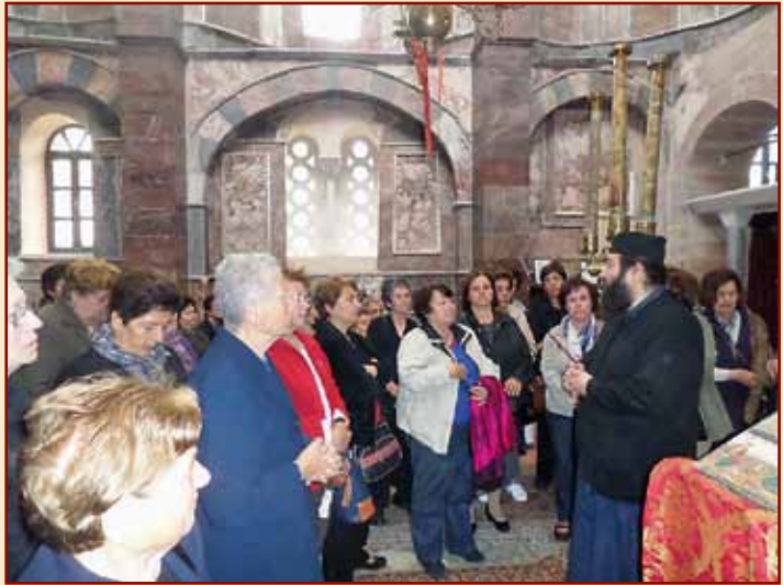
Στήν Νέα Μονή Χίου