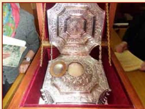
Ἡ Τιμία Κάρα τοῦ Ἁγίου Ραφαήλ

Καὶ ἐκεῖ στὴν θολόκτιστη ἐκκλησιά παραμονὴ τῶν Μυροφόρων φέρνουμε κι ἐμεῖς τὰ μύρα τῆς καρδιάς μας. Ἐνα μικρὸ εὐχαριστῶ στὸν Ἅγιο Ραφαήλ γιὰ τοῦ πόνου τὴν ἀνοιξη καὶ τὴ γλύκα τῆς χαρᾶς.