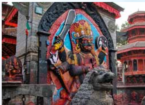
Ναός αφιερωμένος στο Σίβα τόν καταστροφέα, στην Κατμαντού.

Τραγική κατάληξη αυτής τῆς ἀπαίτησης οἱ αἱματηρές θυσίες πού ἀνέκαθεν προσφέρονται πρὸς τίς θεότητες Σίβα γιὰ προστασία καὶ φώτιση, Κάλι καὶ Bhairava γιὰ ἐξουσία καὶ πλοῦτο, Ντούργκα γιὰ τὴ νίκη πάνω στοῦ κακοῦ, Γκανέσα γιὰ πλοῦτο καὶ ἐπιτυχίες, Bhimsen γιὰ κέρδη κ.ἄ. ὠφέλειες, Kuldevta γιὰ τὴν προστασία τοῦ γάμου... 1 Κανένας προβληματισμός ἀνα-