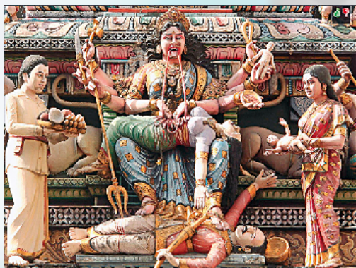
Τὰ πάντα προσφέρονται θυσία σὴν ἀχόρταγη Κάλι.

Στίς γιορτές Puja Durga στίς ἀρχές Ὀκτωβρίου 2012, σύμφωνα μὲ τὴν Daily Telegraph, στήν Ἰνδία καὶ τὸ Νεπάλ, οἱ δημόσιες πλατείες καὶ προαύλια ναοῦ ἔγιναν κατακόκκινες, γέμισαν αἷματα. Χιλιάδες βουβάλια κ.ἄ. ζῶα ἀποκεφαλίστηκαν τελετουργικά σὲ μιά προσπάθεια νὰ κατευναστεῖ ὁ δαίμονας θεᾶς Durga.